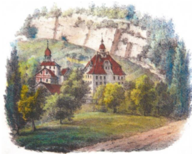
Weinburg în vremea copilăriei regelui Carol I. Litografie de Friedrich Pecht, 1832, expusă în incinta clădirii istorice din Weinburg (fotocopiată de autor, cu acordul conducerii gimnaziului Marienburg cu ocazia unei vizite în anul 2009).

U n an mai târziu, vizita avea să fie una forțată de împrejurări. Valul revoluționar a cuprins și micul principat Hohenzollern Sigmaringen. Pus în fața revoltei locuitorilor din Sigmaringen, bătrânul principe Karl a abdicat, trecând suveranitatea principatului Hohenzollern în mâinile fiului său Karl Anton, în 27 august 1848 14 . Curând după aceea, revolta s-a radicalizat. La o adunare populară în satul Trillfinger, din 24 septembrie 1848, cu cca. 4-5000 de participanți, a fost expus un dovreac vopsit în culorile alb-negru (culorile casei princiare), având înfiptă în el o sabie 15 . Amenințarea la adresa principelui era evidentă. Două zile mai târziu, un grup radical, care contesta autoritatea principelui, a constituit la Sigmaringen un „comitet al securității”, care avea intenția să preia prerogativele guvernului 16 . În replică, principele și guvernul au plecat „în exil” 17 . Pentru a-și pune la adăpost familia în fața unor eventuale excese „revoluționare”, principele Karl