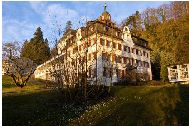
Gimnaziul Marienburg în Thal, cantonul St. Gallen, Elveția, clădirea istorică; imagine preluată de pe site-ul Ordinului misionarilor Styler ( https://www.steyler.ch/ch/niederlassungen/thal.php ).

pe baza taxelor percepute de la elevi, dar și a donațiilor pe care reușea să le strângă. Dar lipsa subvențiilor din partea statului a făcut imposibilă și această misiune.